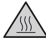
Uwaga! gorąca powierzchnia